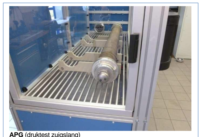
APG (druktest zuigslang)