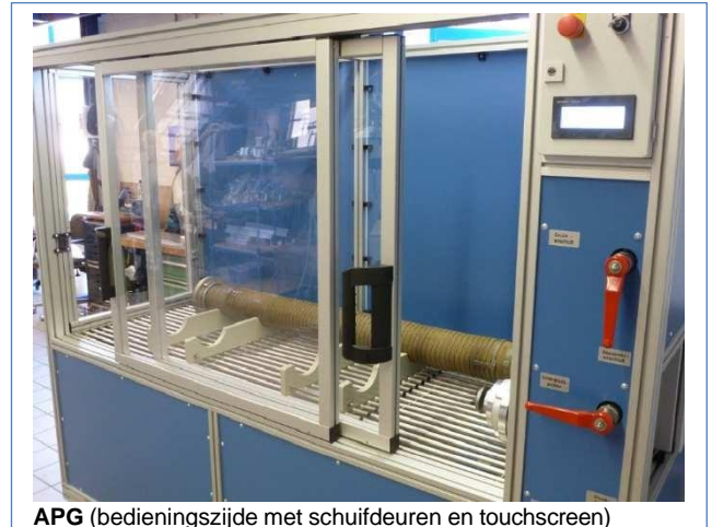
APG (bedieningszijde met schuifdeuren en touchscreen)

Stroomaansluiting: 3,0 kw / CEE-stekker 16A